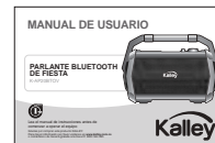
Manual de usuario